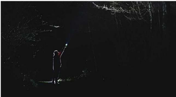
Por la noche el bosque se transforma en un mundo fascinante y misterioso. La naturaleza, guías por Terix, en el mes de agosto. #Terix

Lo llaman 'Agosto Noctámbulo', tendrá lugar durante ocho fechas (viernes y sábado) y consiste en una ruta suave por la noche del bosque, descubriendo un mundo fascinante lleno de vida, aprendizajes y criaturas increíbles