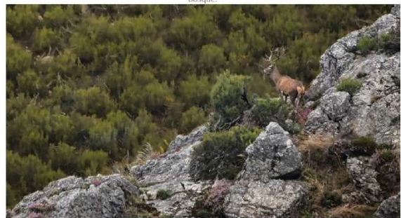
El bramido de la montaña es una gran experiencia por descubrir al tiempo que se descubre la berrea del ciervo en el Parque Natural de Redes. #Terix

Tendrán lugar al atardecer, hasta el 12 de octubre, durante todos los viernes, sábados y domingos. Un ciclo de paseos senderistas sencillos para escuchar la berrea del ciervo al tiempo que se descubre su fascinante biología y los secretos del bosque.