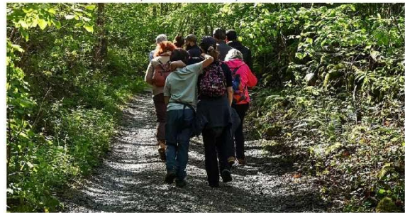
Figuras de la naturaleza. Paseos senderistas guiados por biólogos y guías de Terix en el río Pezón y el río Matorral del Parque Natural de Redes. #Terix

El río Pezón y el río Matorral serán los escenarios en los que se desarrollarán los próximos domingos 15 y 22 de junio 'Siguiendo la corriente', una actividad guiada por biólogos e ideada para que toda la familia sienta y conozca el fascinante espectáculo de la vida salvaje de ribera