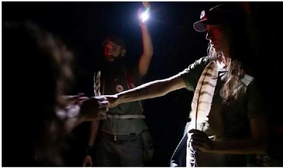
Noticias de un paseo nocturno por el bosque y senderismo, que en Terix se ha ido haciendo todo los sábados del mes de marzo. #Terix

Una actividad pensada para toda la familia que se extenderá durante todos los fines de semana de marzo y combina dos aventuras: el senderismo en la oscuridad y conocer mejor a las aves nocturnas